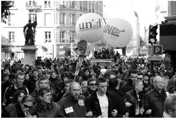
Демонстрація в Парижі 1 травня 2020.

«Як і здоров'я, наші свободи не підлягають обговоренню!»