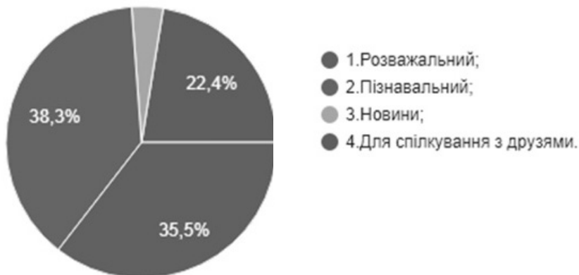
Рис. 1. Відповіді на питання: «Який контент Вас більше цікавить?»

такі основні функції: 1) об'єднувати людей; 2) сприяти поширенню знань; 3) інформувати щодо напрямів діяльності; 4) координувати дії та інше.