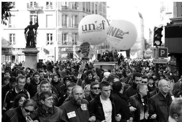
Демонстрація в Парижі 1 травня 2020.

«Як і здоров'я, наші свободи не підлягають обговоренню!»