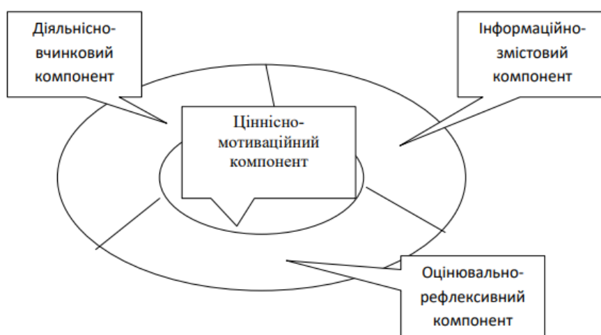
Рис. 1. Схема компонентної структури готовності майбутніх учителів до морального виховання учнів початкової школи за В. В. Петляєвою [6].

Ціннісно-мотиваційний компонент у структурі визначеної готовності являє ядро всієї структури. Він передбачає сформовані ціннісні орієнтації та наявність комплексу особистих і професійних якостей, що характеризують спрямованість майбутнього вчителя на моральне вдосконалення (комплекс ціннісно-соціальних установок, усвідомлення цілей духовно-морального розвитку особистості, визнання цінності духовного становлення дорослої людини; наявність інтересу до внутрішнього особистісного зростання, здатність до розкриття внутрішнього особистісного потенціалу, прагнення до самовдосконалення). Зазначимо, що власне поняття «цінність» є багатовимірним. Зокрема, у дослідженні Н. О. Ткачової наголошується, що для педагогічних працівників «виникає необхідність не тільки у визначенні провідних для педагогічного процесу цінностей, але й у пошуку ефективних засобів їх трансляції молоді, формування в кожній особі її персональної системи цінностей» [7, с. 15].