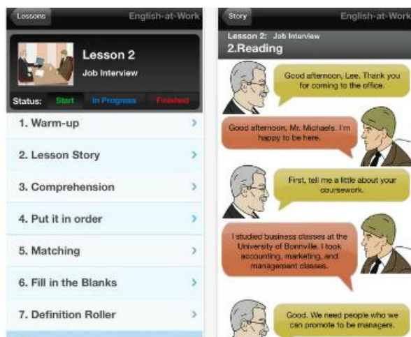
Рис. 2. Приклад додатка “English at Work”

Наступний додаток, “English at Work” (рис. 2), підійде майбутнім фахівцям, робота яких буде пов’язана з соціальною сферою життя, отже, високий рівень сформованості соціально-комунікативної компетентності є невід’ємною складовою їх фахової майстерності. Користувачі зможуть удосконалити як розмовні навички, так і навички ділового листування; поповнити словник новою лексикою і запам’ятати багато корисних фраз, які можуть зустрітися у професійній сфері.